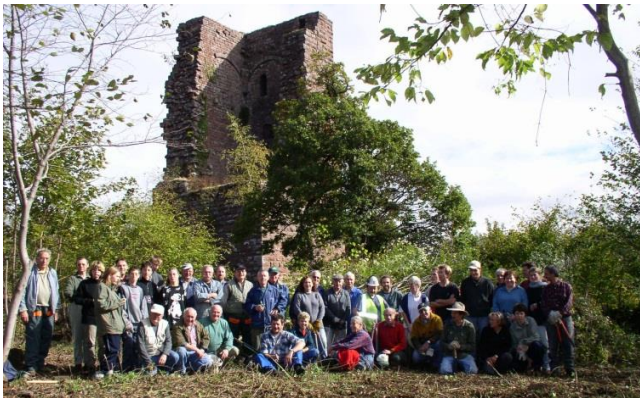
Débroussaillage au château du Grand Geroldseck

C'est ainsi qu'ont été créés les veilleurs de châteaux forts , réseau de bénévoles qui surveillent ces 46 ruines et signalent les éventuels problèmes au Département. Ces veilleurs, d'abord isolés, se sont ensuite fréquemment constitués en associations pour décupler leurs interventions sur les ruines et entreprendre des travaux pour consolider les sites fragiles, avec les conseils de l'architecte du patrimoine du Département du Bas-Rhin, évitant ainsi la dégradation du site. A ce jour, ce réseau compte plus de 20 associations dont 17 consolident les vestiges.